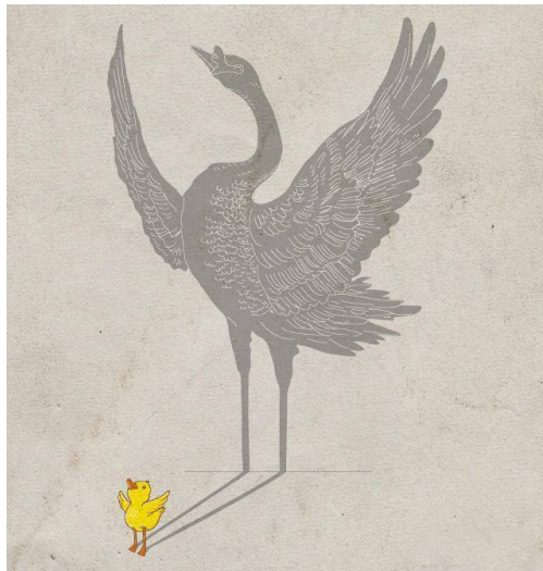
【圖七】(網路截圖) 請欣賞並協助這批「靛藍/新小孩/鶴」展翅高飛吧~

天生大不同!! 不管是哪種與多數的我們屬性與特性不同的人，雙方都要學習了解彼此，多數要學習/接納並欣賞少數、少數則有義務要適應多數，希望大家因為「鶴」與「雞」世代這種比喻，促使人與人之間更和諧、互助、關懷的關係，不再批判、而是相互提醒，因彼此理解、包容、接納、欣賞、合作，雙方開始學習迎接「多元物種共存的繽紛世界」，一起回歸生命的守護與照顧。下次感受到身邊哪個孩子非常與眾不同/難以理解時，請先停下來、用心感受一下，他是不是又是一個即將帶領雞世代展翅高飛的「靛藍/新小孩/鶴」【圖七】呢？一起成為孩子一輩子的貴人吧！