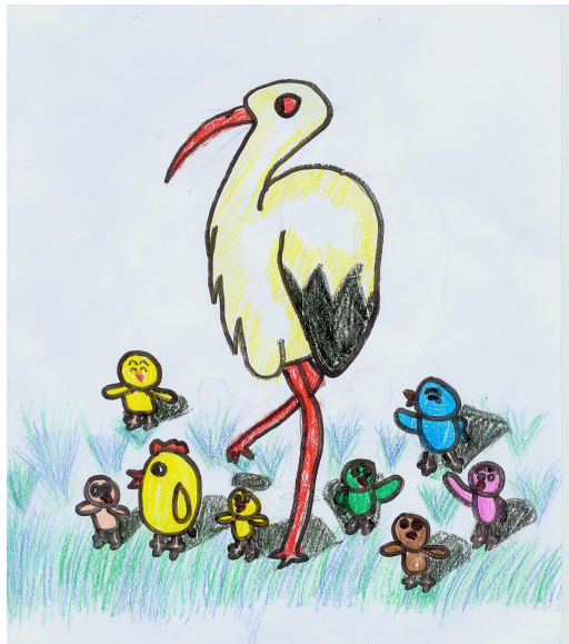
【圖四】(網路截圖) 這批「靛藍/新小孩」一如「鶴立雞群」中的「鶴」(張, 2011)，容易因不被了解而被當成「怪雞」或「病雞」

應的前提下，只會愈長大愈呈現出與群體的差異性以及自我原始樣貌，更容易因格格不入而被當孤傲的那批——這點則是與傳統的新移民者住愈久、愈適應這個環境是不同的。