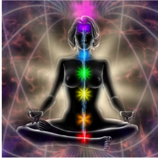
【圖三】(網路截圖)「靛藍/新小孩」具有大量「七脈輪」中「心輪」以上冷色系能量場，因而命名