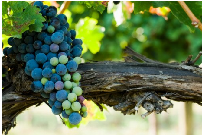
【圖二】(網路截圖) 這批「靛藍/新小孩」擁有高智慧「白葡萄」，呈現出不一樣的高知識庫與性格特質

在心中構思「葡萄理論」概念且於演講中推廣多年之後，也就是我離開醫學中心獨立開業之後，開始有多重人格（我喜歡稱他們為「心靈家族」個案）的高智慧靈體/意識/葡萄/人格出來和我對話，不再是過往常聽的「感性面小葡萄」創傷記憶，讓我可以協助他們走出創傷的內容，而是開始和我談論生命的本質、靈性層次、甚至是宇宙大自然——顯然這些高智慧貯存的知識庫與一般人的「紫葡萄」是不同的，我稱他們是具有「白葡萄」【圖二】高智慧的一群，原來他們懂得這麼多身為知識份子、自稱專業的我們所不懂的生命層次！這使得最初提「葡萄理論」只用來描述「人本就是多元組成的」，以及「人格特質」和「人格」的本質相同，開始轉而體悟到結合「靈」於「身-心」的全人觀念，更進一步得以看懂生命。在我 15 年來接案的心靈家族個案中，赫然發現原來他們大量是這批具有「白葡萄」知識庫高階靈體生命的「靛藍/新小孩」！